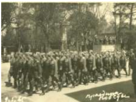
Парад победы 9 мая 1945 г. в Раушене (на трибуне П.Г.Чанчибадзе)

9 мая 1945 г. по улицам нашего города торжественным маршем прошли части 2-й гвардейской армии.