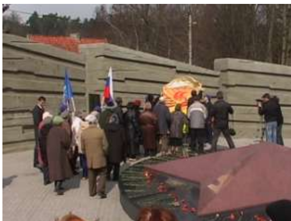
Торжественное открытие Аллеи Славы ветеранов Великой Отечественной войны 14 апреля 2010 г. в честь 65-летия Великой Победы .Аллея Славы протянулась от разворотного кольца при въезде в Светлогорск до мемориального комплекса. Вдоль автомагистрали на Калининградском проспекте, с правой стороны установлены полутораметровые щиты с фотографиями участников Великой Отечественной войны, что поныне проживают в Светлогорском районе.