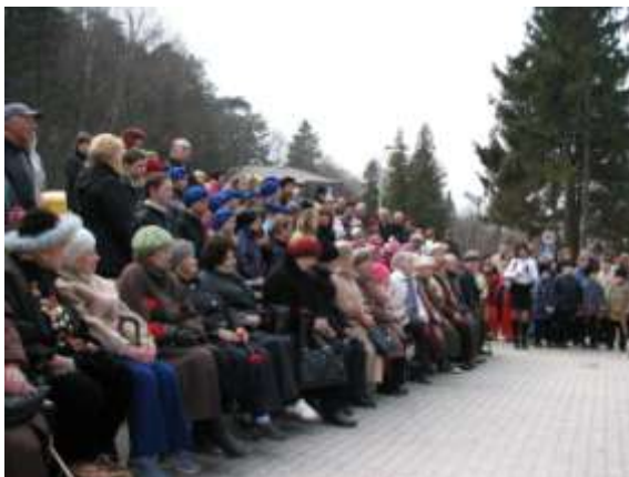
Митинг, посвященный 65-летию взятия советскими войсками Раушена. Светлогорск, 14 апреля 2010 г.